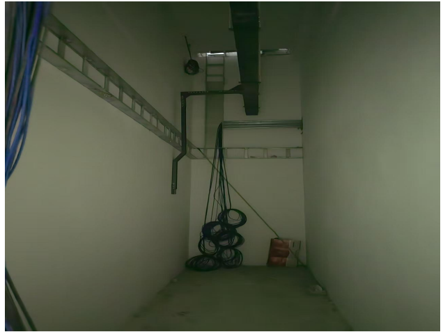
二、配电间桥架安装