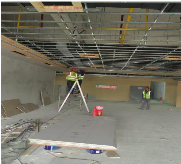
三、二层天花龙骨安装