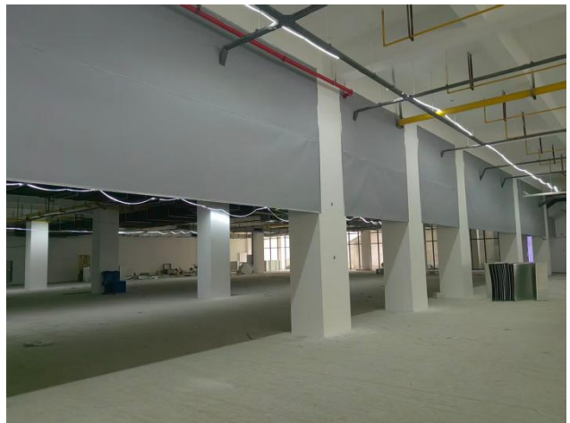
四、地下室防火垂帘