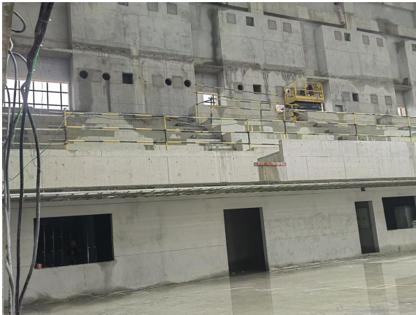
三、暖通风管开洞,封闭预留