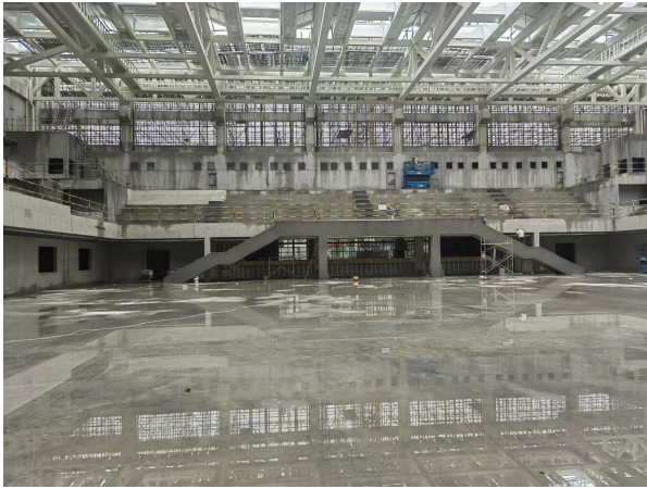
一、屋面不锈钢天沟安装