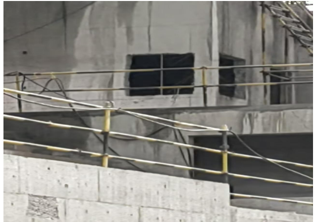
二、设备房开设窗户(计4处)