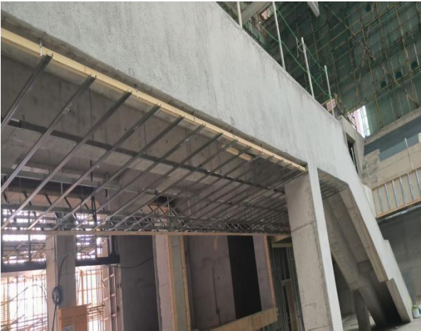
三、看一下天花龙骨安装