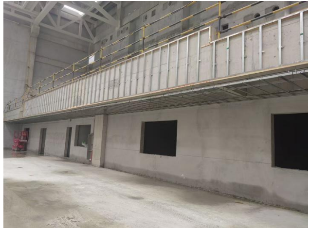
二、看台立面墙面龙骨安装