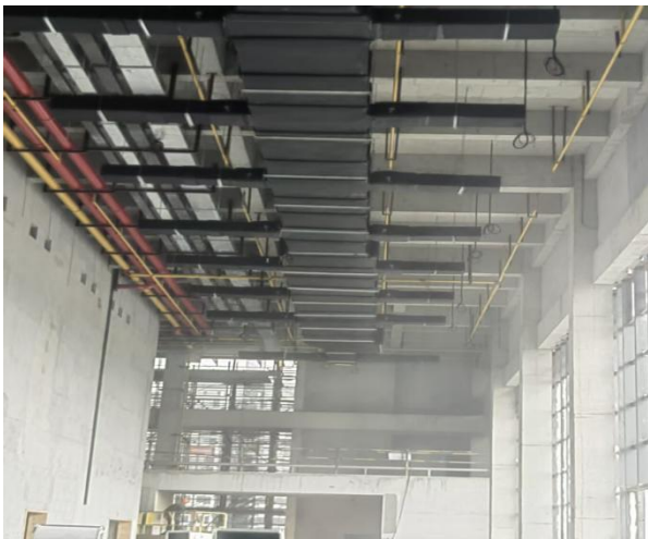
三、二层风管保温层安装