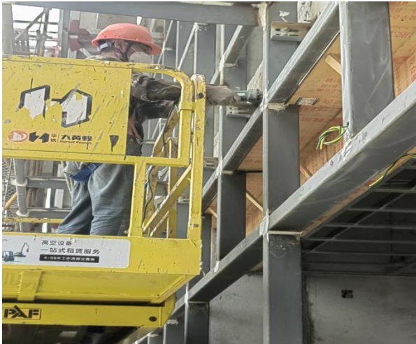
一、幕墙骨架焊接点打磨做漆